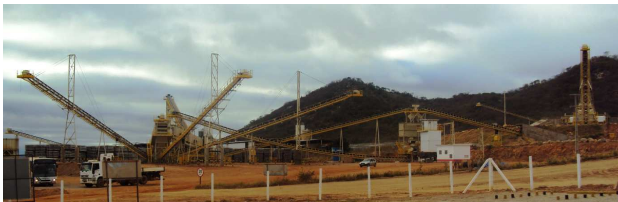
Figura 9 – Central de britagem