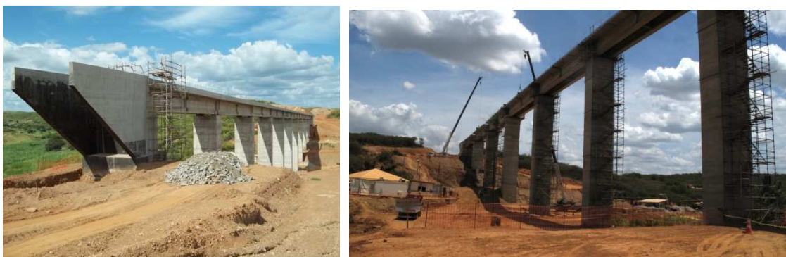
Figura 6 – Ponte sobre o riacho Formiga