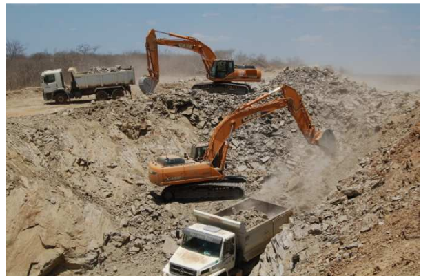
Figura 4 – Execução de aterro e corte em rocha