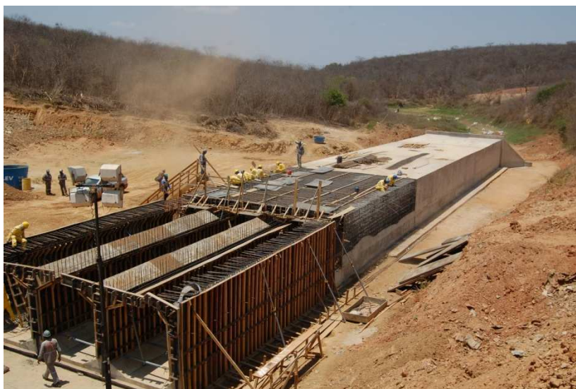
Figura 5 – Execução de bueiro celular triplo