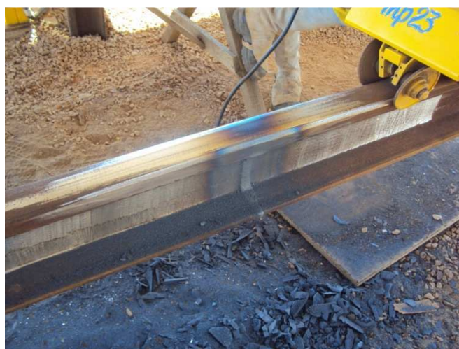
Figura 10 – Preparação, solda e esmerilhamento do trilho