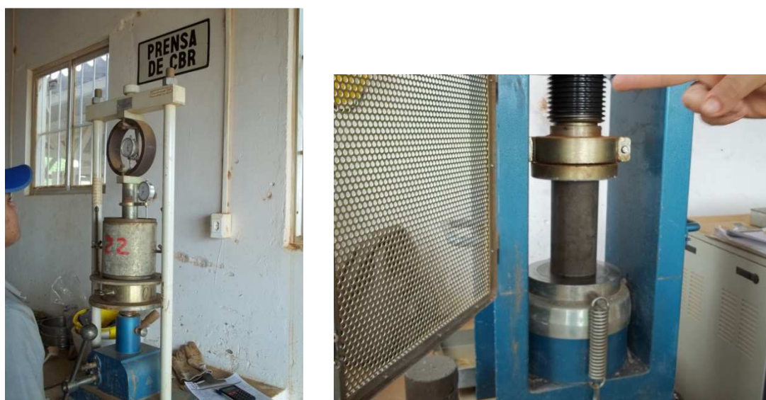
Figura 2 – Determinação de CBR e ruptura de corpo de prova