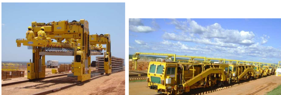
Figura 12 – Equipamentos para montagem da grade