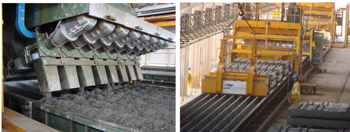
Figura 11 – Concretagem e retirada dos dormentes