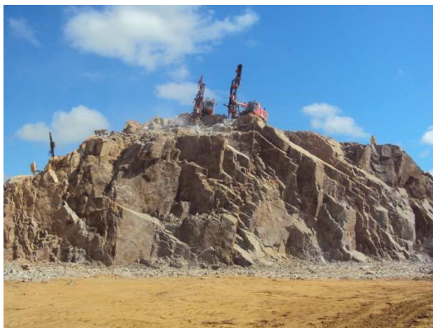
Figura 8 – Perfuratrizes na bancada da pedreira