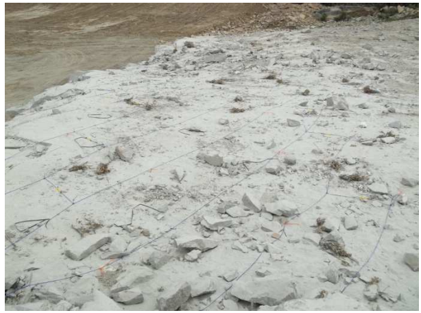
Figura 3 – Explosivos e bancada preparada para detonação