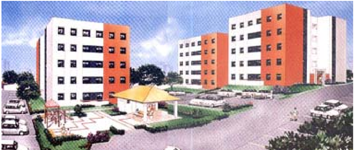
Figura3. Vista em perspectiva do Residencial Juréia.

Residencial Juréia: está localizado na quadra 13 da rua Alves Seabra, consistindo de cinco prédios de 5 pavimentos. O pavimento térreo dispõe de apartamentos e a garagem sem cobertura. As figuras 3, 4 e 5 ilustram, respectivamente, sua vista em perspectiva, a vista de topo e a planta-baixa de um apartamento-tipo: