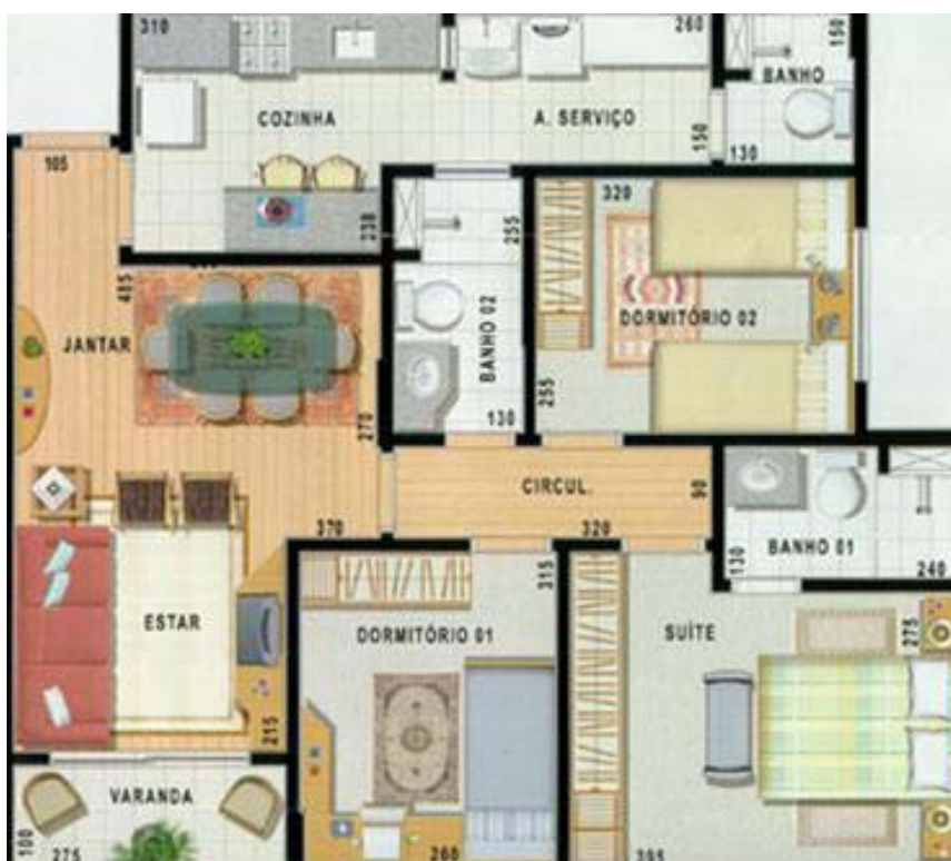
Figura 2. Planta-baixa de um apartamento-tipo do Edifício Abrolhos.