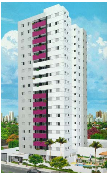
Figura 1. Vista em perspectiva do Edifício Abrolhos.