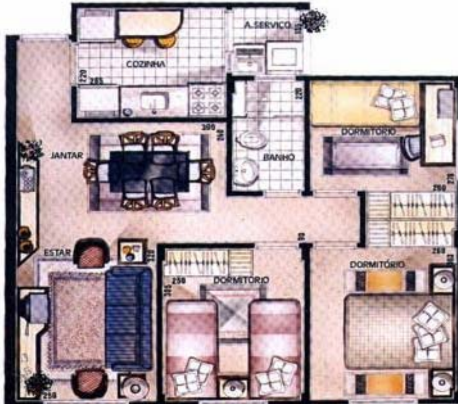
Figura 5. Planta-baixa de um apartamento-tipo do Residencial Juréia.